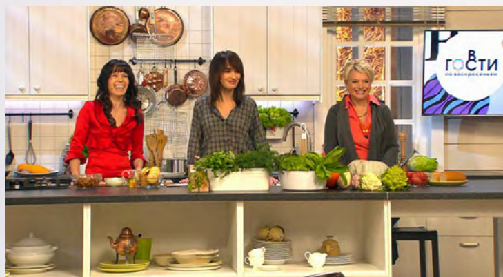
Программа Ирины «Гости по воскресеньям» на «Первом канале».

На сегодняшний день Ирина ведёт программу «Доброе утро» на Первом канале. В 2015/2016 в эфир выходила её авторская программа «Гости по воскресеньям» . В 2014 году она выступала в качестве продюсера и ведущей программы «Парк» также на Первом. До этого Ирина восемь лет работала в одном из самых успешных проектов отечественного телевидения — «Утро России» на телеканале Россия 1.